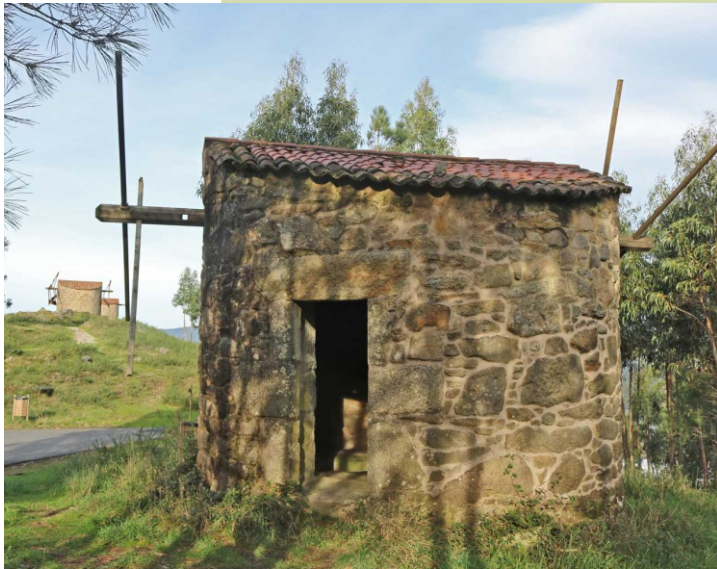
Muíños do monte das Pedras Miúdas (Tras da Veiga) (12-2021)