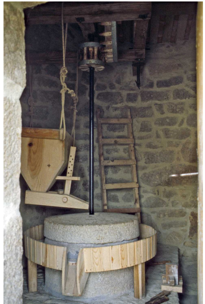
Interior dun dos muíños restaurados

Os muíños de vento de Catoira son únicos na Península Ibérica. Son construcións sinxelas, de cachotes, de planta circular, con cuberta fixa, de tella, a dúas augas e un dobre xogo de abanos unidos a un eixo que atravesa a construción. A cuberta fixa e o dobre xogo de abanos son as características que os fan únicos. Os muíños de vento son orientables, teñen que poder enfrontar as pas ao vento para aproveitar con máis eficacia a súa forza, para iso teñen que poder ser desprazadas e conséguense facendo rodar a estrutura e o tellado que a cubre ou todo o conxunto do muíño. Os de Catoira co seu dobre xogo de pas orientadas aos ventos dominantes na contorna non precisan ser orientados.