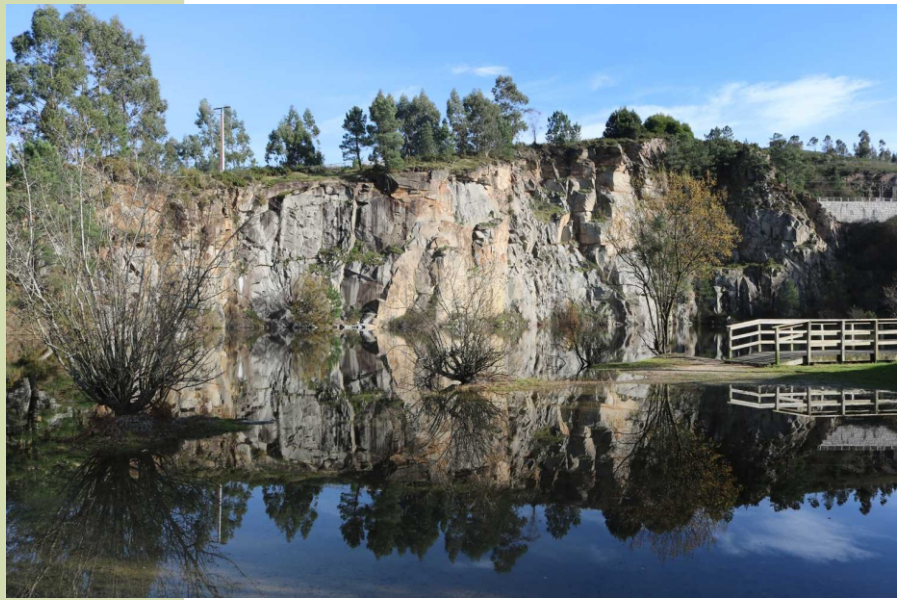
Lagoa das Pedras Miúdas, asentada no oco dunha antiga canteira

Tamén se poden facer visitas puntuais en coche seguindo as indicacións que hai ao pé da estrada. A estrada chega ao pé dos de Tras da Veiga e desde Abalo seguindo as indicacións da igrexa e desde alí a dos muíños ata onde do camiño sae un desvío á dereita, de terra pouco transitado onde temos de deixar o coche para camiñar uns 500 m para chegar ao cume do monte Mesón.