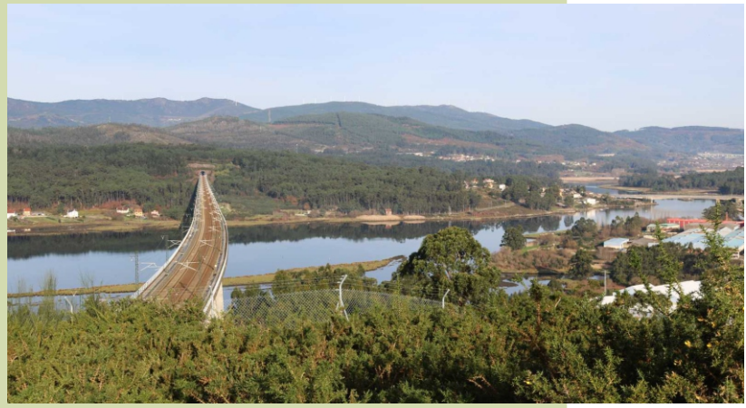
Vista do esteiro do Ulla desde o monte das Pedras Miúdas

Os muíños de Catoira son de planta circular, construídos con cachotería de granito, arredor do século XIX. A cuberta é a dúas augas, de tella do país suxeitas con pedras para evitar que o vento as levante. Teñen unha única porta e o interior ten unha única planta onde van instalados os elementos mecánicos para moer.