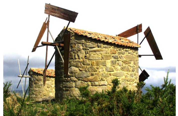
Muíños do monte das Pedras Miúdas (Tras da Veiga) (2001)