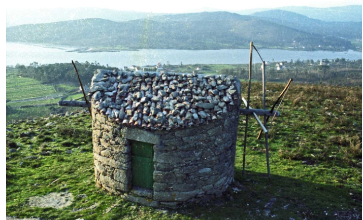
Muíños do monte das Pedras Miúdas (Tras da Veiga) (1979)