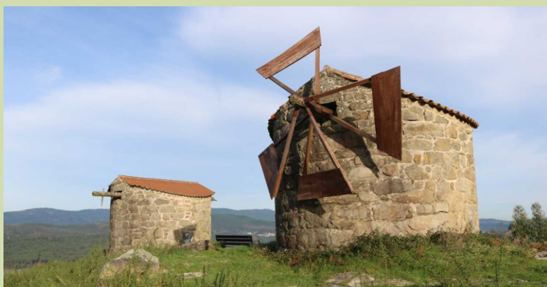
Muíños do monte das Pedras Miúdas (Tras da Veiga) (12-2021)