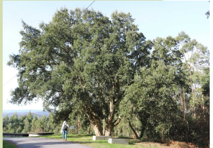
Sobreiras de Cores

O único muíño que conserva a estrutura orixinal (monte Mesón)